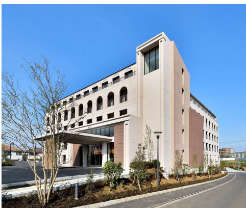
高根台複合福祉施設たか音の杜（千葉県船橋市高根台2-10-30）